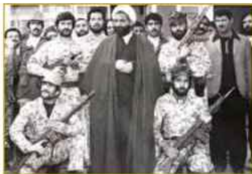
روز کمیته انقلاب اسلامی با حضور آیت الله جلالی خمینی پس از شرفیاب

اولین نهادی که پس از پیروزی انقلاب اسلامی به منظور حراست از دستاوردهای انقلاب توسط جوانان انقلابی از سوی حضرت امام خمینی (ره) شکل گرفت کمیته انقلاب