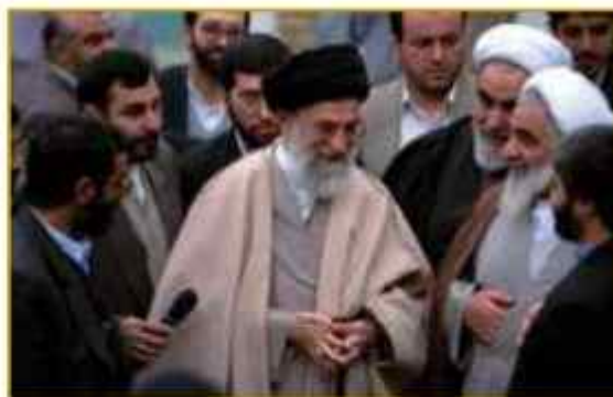
بازدید مقام معظم رهبری آیت امام در خمین