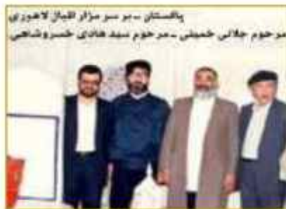
حضور آیت الله جلالی خمینی به نمایندگی از حضرت امام خمینی در پاکستان

به صورت یک پارچه و عظیم، به خروش و حرکت درآمده و با حمایت قاطع از حکم رهبر انقلابی خود، نفرت و انزجار خویش را از این دسیسه و توطئه استعماری به نمایش نهادند و خواستار محاکمه سلمان رشدی و ممنوعیت چاپ و انتشار و جمع آوری این کتاب شدند. امام خمینی (ره) در اقدامی دیگر با انتخاب هیات سه نفره ای مشکل از آیت الله جلالی خمینی، آقای خسروشاهی سفیر ایران در ایتالیا و آقای اسحاق مدنی نماینده اهل تسنن به کشور پاکستان به منظور شرکت در مراسم شهدای نظاهرات پاکستان اعزام نمودند که به محض ورود هیات ایرانی، وقتی سفیر ایران در پاکستان متوجه می گردد که این هیات به منظور شرکت در مجلس شهدای پاکستان آمده ناراحت شده و از بیم آنکه امکان دارد موضوع فوق به ارتباط میان کشور پاکستان و ایران تاثیر نامطلوبی داشته باشد، نظر به شرکت نمودن هیات ایرانی در این مجلس را نداشتند. اما از آنجاییکه آیت الله جلالی خمینی با روحیات امام (ره) آشنا بودند از هیات ایرانی جدا شده و با مشکلات فراوان خود را به مراسم شب هفت شهدای و پاکستان رسانده و ضمن ابلاغ سلام امام (ره) و همدردی امام خمینی با خانواده شهداء و سایر مردم پاکستان به ایراد سخنرانی پرداختند که این امر موجب خرسندی خانواده شهدا و مردم پاکستان شده و مراتب قدردانی خود را از رهبر انقلاب اعلام نمودند. اخبار مراسم فوق با حضور نماینده امام