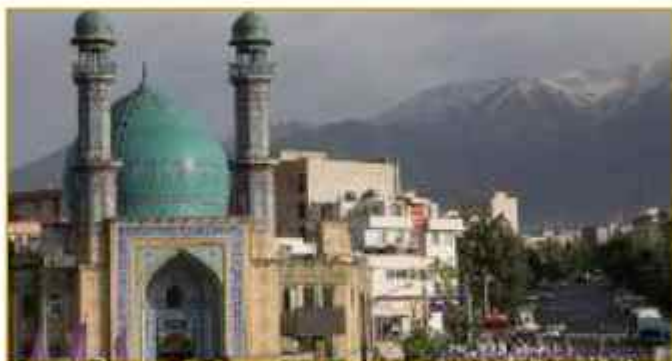
مسجد الرسول، میدان رسالت