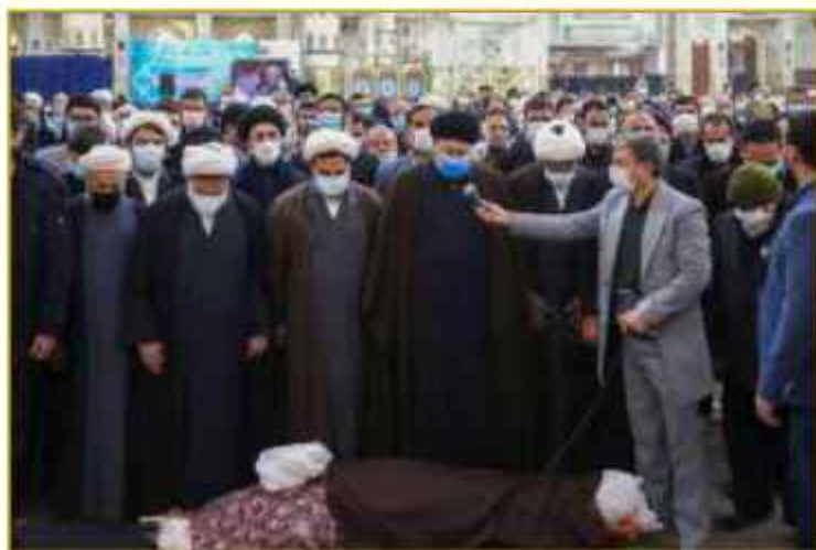
مراسم تشییع بزرگ عالم مجاهد آیت الله حیدر علی حلاجی خمینی (قدس سره الشریف)

غفر الله لنا و له و حشره الله مع الاولیاء و الصدیقین