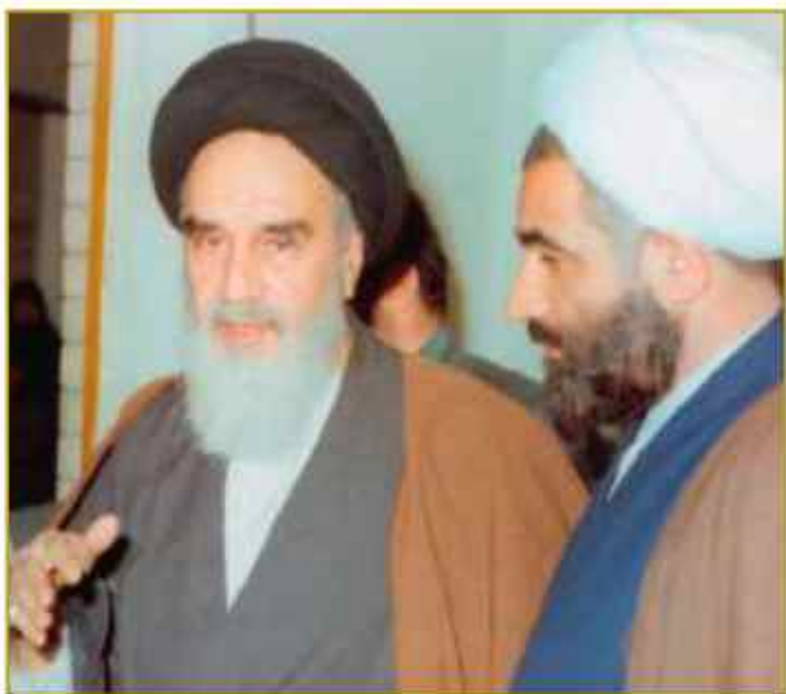
آیت الله جلالی خمینی در میزبان امام خمینی (ره)