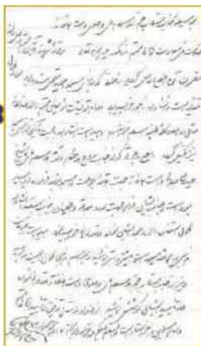
حکم حضرت امام خمینی (ره) به آیت الله جلالی خمینی در