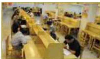
کتابخانه برادران مسجد احمدیه نارمک

دهی و امر کتابداری در کارنامه کاری و خدمات رسانی کتابخانه و پرسنل زحمتکش آن ثبت گردید.