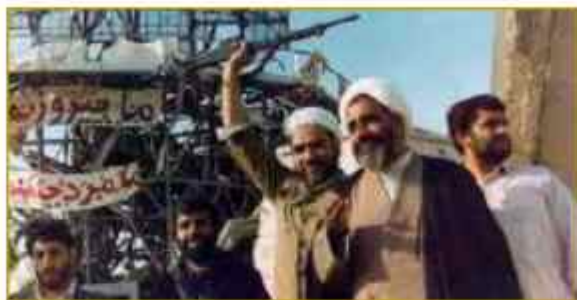
حضرت آیت الله جلالی حسینی در جبهه های حق علیه باطل

و سرزمین ایران اسلامی و استقلال آن حفاظت کرده و مردم مسلمان را نیز بدین امر فراخوانده اند.