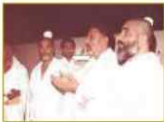
حضرت آیت الله جلالی خمینی در حج به عنوان نماینده امام خمینی (ره)

آیت الله جلالی خمینی بعد از پیروزی انقلاب همراه با امام (ره) سعی نمود