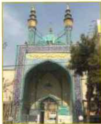
ساخت مسجد ابا عبدالله الحسین علیه السلام توسط آیت

حضرت امام خمینی (ره) در این مساجد به عنوان امام جماعت مشغول به فعالیت‌های انقلابی شدند.