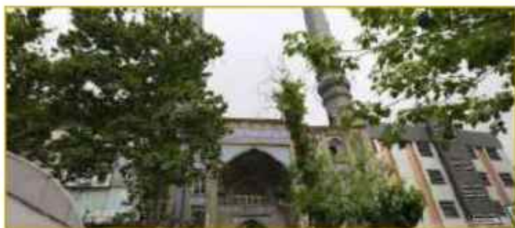
ساخت مسجد ائمه هدی (ع) توسط آیت الله جلالی خمینی قدس سره الشریف

سینما در رژیم پهلوی از جمله مراکز نشر فساد اخلاقی و تهاجم فرهنگی علیه اعتقادات مردم بود، یکی از راههای مقابله با این تهاجم فرهنگی تبدیل این مراکز به مسجد و حسینیه بود، پدیده ای که نگرانی و خشم ساواک و شهربانی و دیگر منابع امنیتی رژیم منحوس پهلوی را برانگیخته بود. در این راستا خرید سینمای مونت کارلو توسط افراد خیر در منطقه هفت حوض نارمک در قیل از انقلاب و تبدیل آن به مسجد، دومین فعالیت مهم آیت الله جلالی خمینی در تهران بود که در آنجا هم توسط آیت الله العظمی خوانساری افتتاح و مورد مخالفت شدید ساواک و روزنامه های رژیم منفور پهلوی قرار گرفت. پس از تبدیل سینما به مسجد و خواندن نماز توسط آیت الله العظمی خوانساری از مرحوم علامه جعفری (ره) جهت اقامه ی نماز جماعت دعوت بعمل شد که