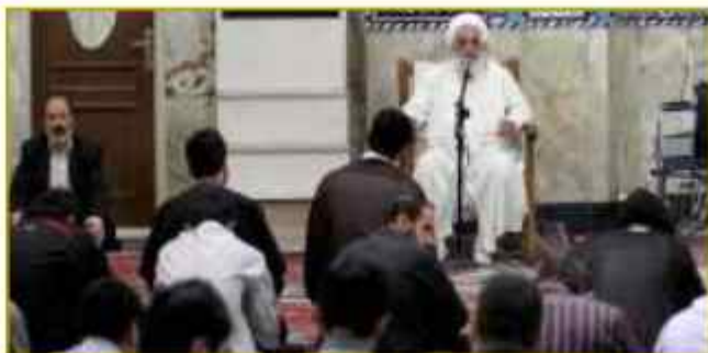
برس آملای حوزہ علمیہ آیت اللہ جلالی خمینی